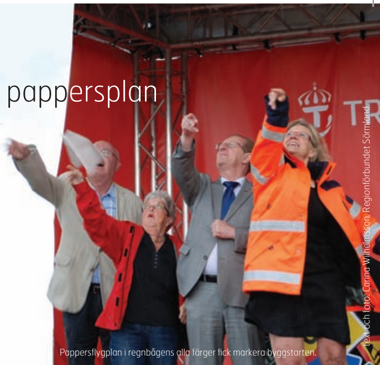
Pappersflygplan i regnbågens alla färger fick markera byggstarten.

Den nya vägsträckan ansluter cirka en kilometer väster om nuvarande korsning mellan väg 52 och väg 627. I anslutning till den nya vägen kommer också en gång- och cykelväg att byggas. ■