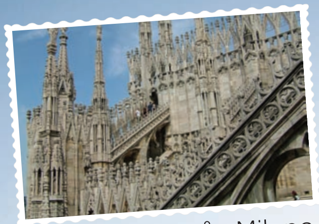
Vykort från Milano