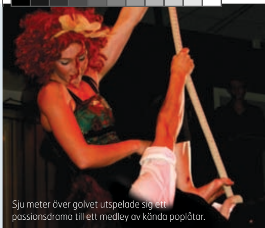
Sju meter över golvet utspelade sig ett passionsdrama till ett medley av kända poplåtar.