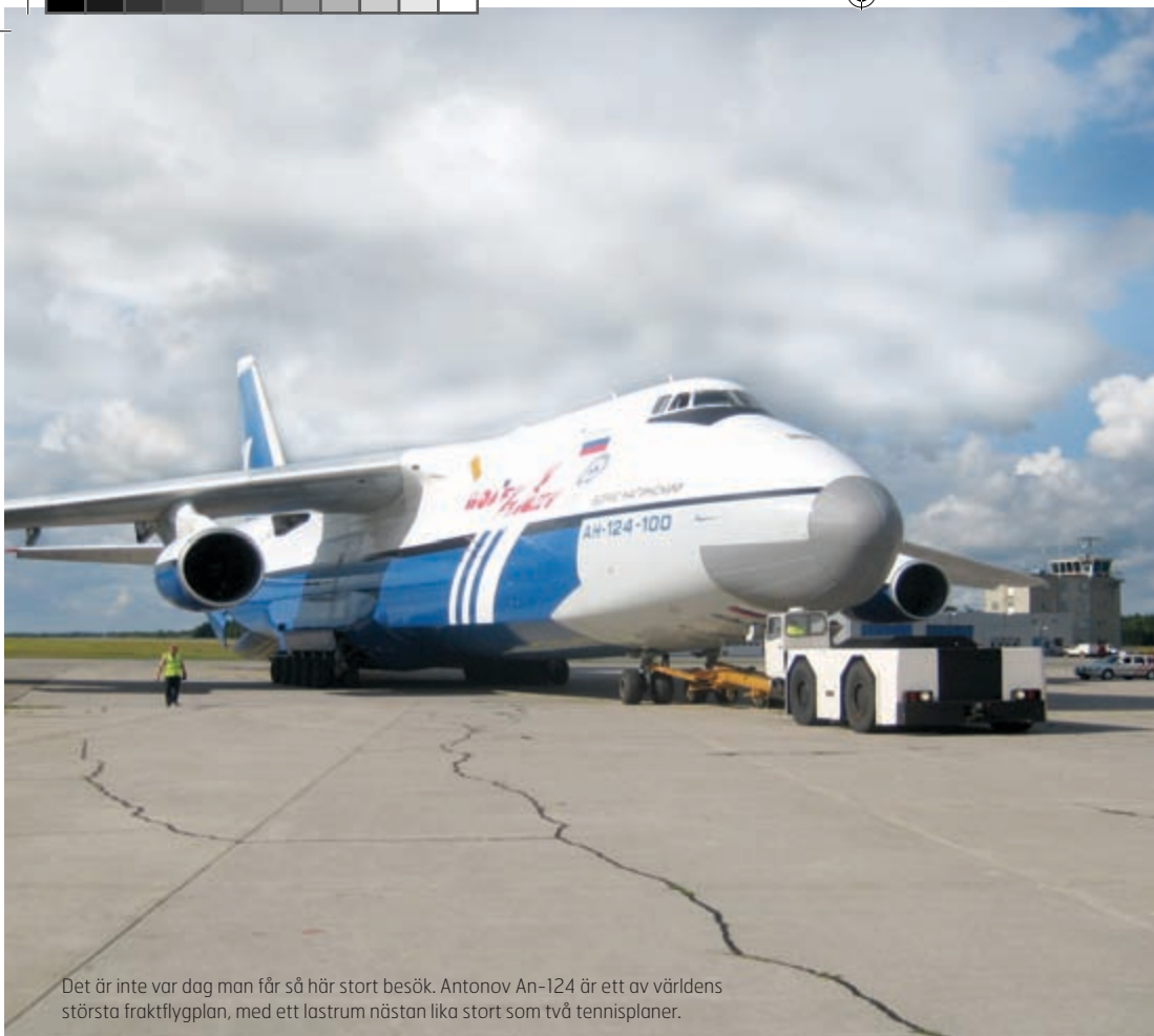
Det är inte var dag man får så här stort besök. Antonov An-124 är ett av världens största fraktflygplan, med ett lastrum nästan lika stort som två tennisplaner.