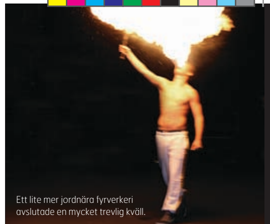
Ett lite mer jordnära fyrverkeri avslutade en mycket trevlig kväll.