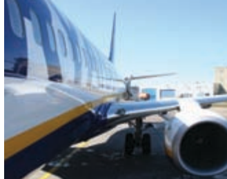
Ryanair drar fördel av att allt fler söker sig till billiga resealternativ.