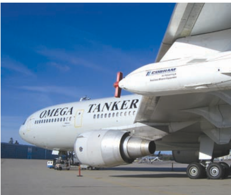
Under KDC 10:ans vinge sitter den så kallade podden där bränsleslangen som används vid lufttankningen ligger uppevad.