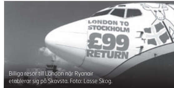
Billiga resor till London när Ryanair etablerar sig på Skavsta.