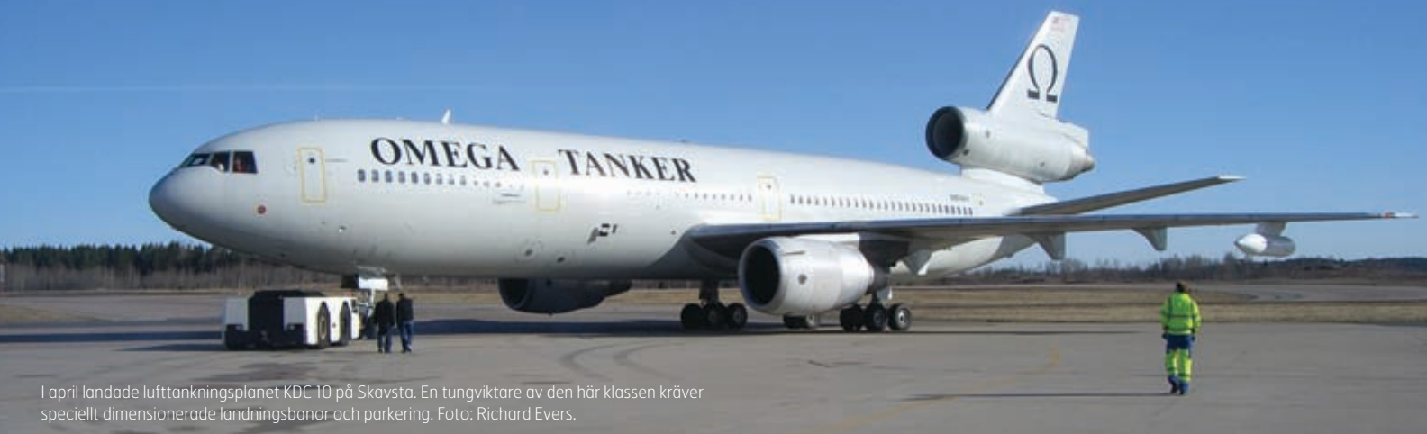
I april landade lufttankningsplanet KDC 10 på Skavsta. En tungviktare av den här klassen kräver speciellt dimensionerade landningsbanor och parkering.