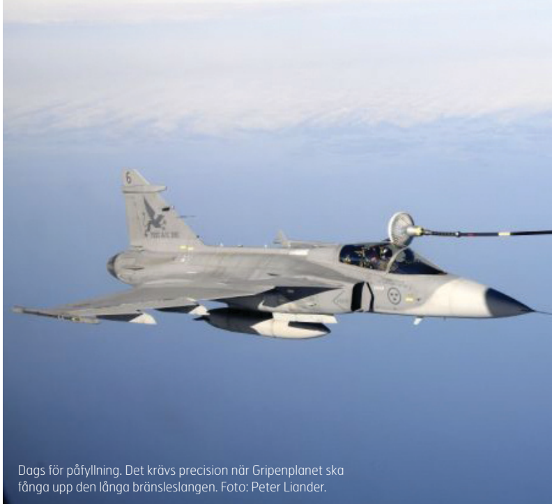
Dags för påfyllning. Det krävs precision när Gripenplanet ska fånga upp den långa bränsleslangen.